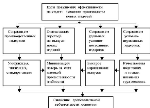
Рисунок 1.1 - Схема основных направлений получения экономического эффекта в процессе освоения новых изделий

Слово «Таблица...» указывают слева над первой частью таблицы. Над другими частями таблицы также слева пишут слова «Продолжение таблицы...» с указанием ее номера. Название при этом помещают только над первой ее частью. Допускается помещать таблицу вдоль длинной стороны листа (альбомная ориентация листа). Название таблицы оформляется сверху слева без абзачного отступа Times New Roman, не выделяя полужирным, размер шрифта - 14 пт, название таблицы приводят с прописной буквы без точки в конце. На все таблицы в ВКР (ДП (ДР)) должны быть ссылки. При ссылке следует печатать слово "таблица" с указанием ее номера. Внутри таблицы Times New Roman, размер шрифта - 12 пт, междустрочный интервал одинарный.